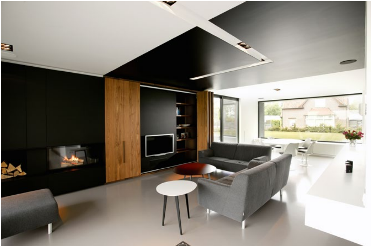
Strak en speels gaan hier samen. Deze Deslee-stek straalt klasse en rust uit.