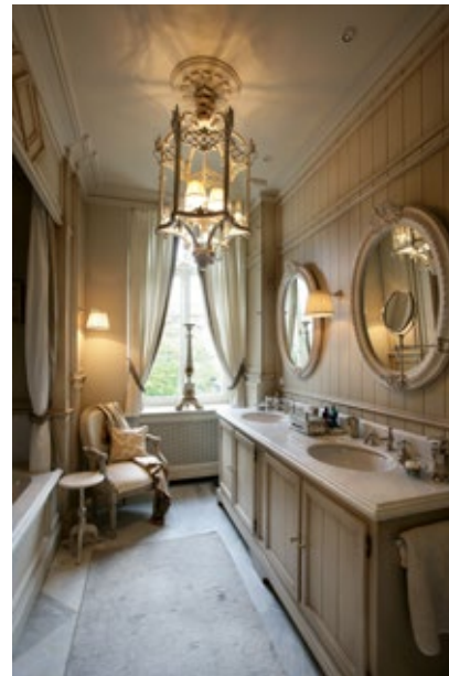
Dit interieur oogt op-en-top Porters, we worden door een wauw-gevoel overrompeld.