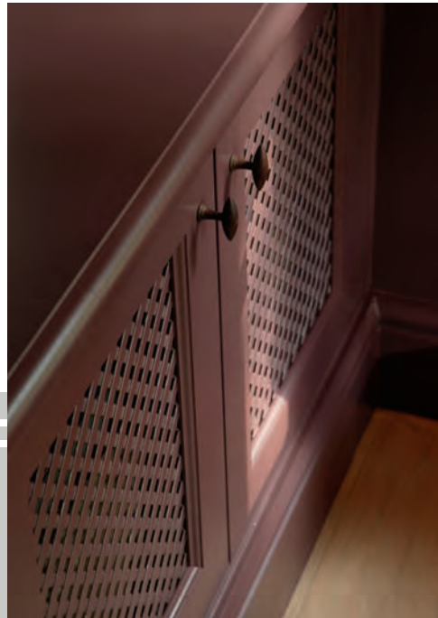
De door Peter Deckers geverfde bibliotheekkast heeft strak sluitwerk als finishing touch.