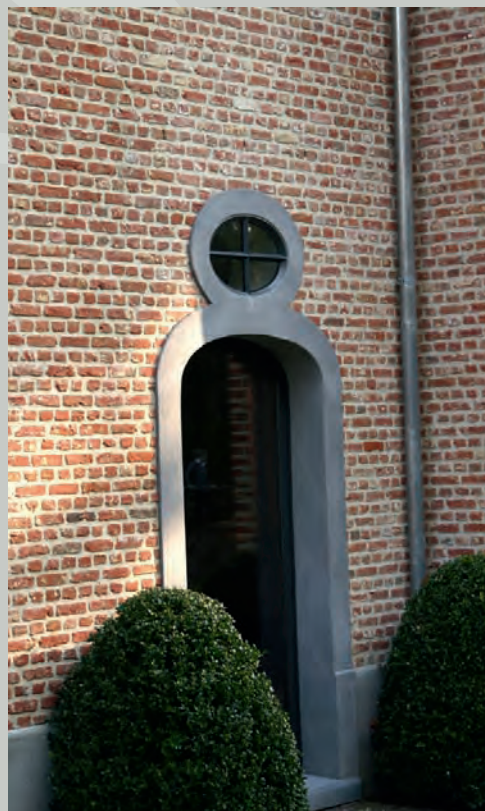
Stijlvol schilderwerk versmelt mooi met het buitengebeuren.

tot september. Ons zwembad is altijd 28 tot 29 graden. Heerlijk!" Hier leeft men overduidelijk - binnen en buiten - in harmonie met de natuur.