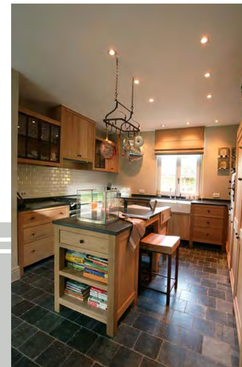
De keuken oogt puur natuur.