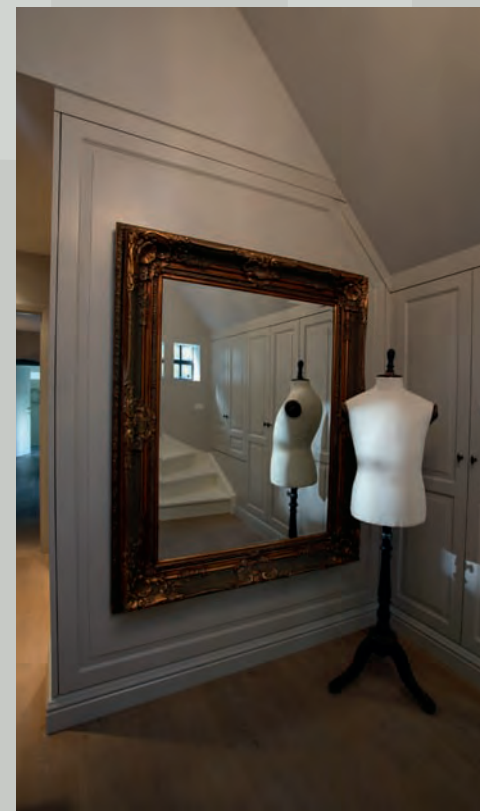
De egaal gelakte dressing, met vergulde spiegel, ziet er prachtig uit.