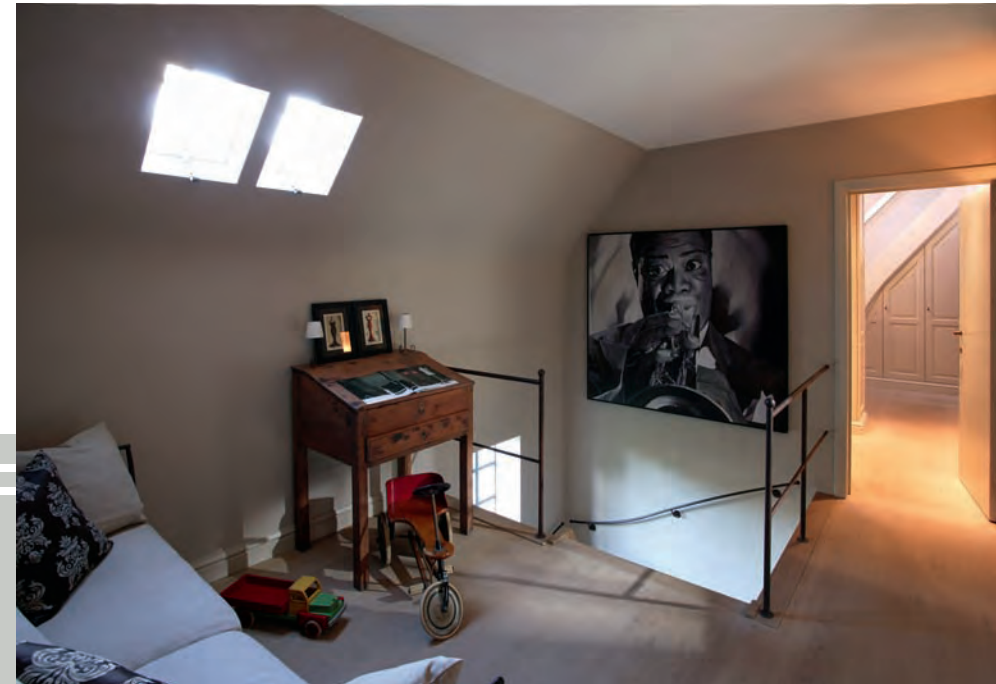
De nachthal biedt plaats aan een muziekkamer. Er prijkt een beeltenis van Louis Armstrong aan de muur.