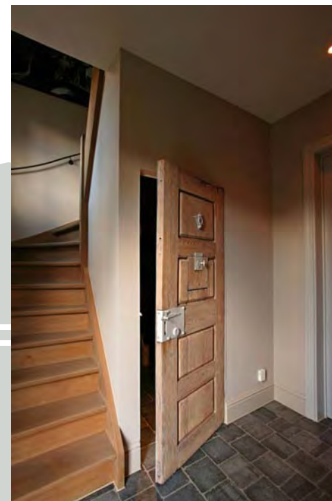
De deur naar het toilet is een oude gevangenisdeur, die lichtjes vergrijsd werd, ter integratie.

De vensters in gebroken wit hebben luiken in grijsgroen. Grijsgroen dat bij de deuren zacht contrasteert met biesjes in een tint lichter. Met donkergrijs geverfde stalen raampjes zet de schilder de puntjes op de i. De uitstraling van het domein evolueert mee met de seizoenen en dat maakt het