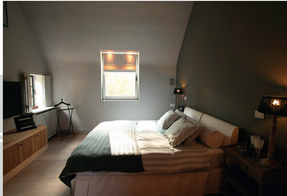
In de slaapkamer heerst een hemelse sfeer.